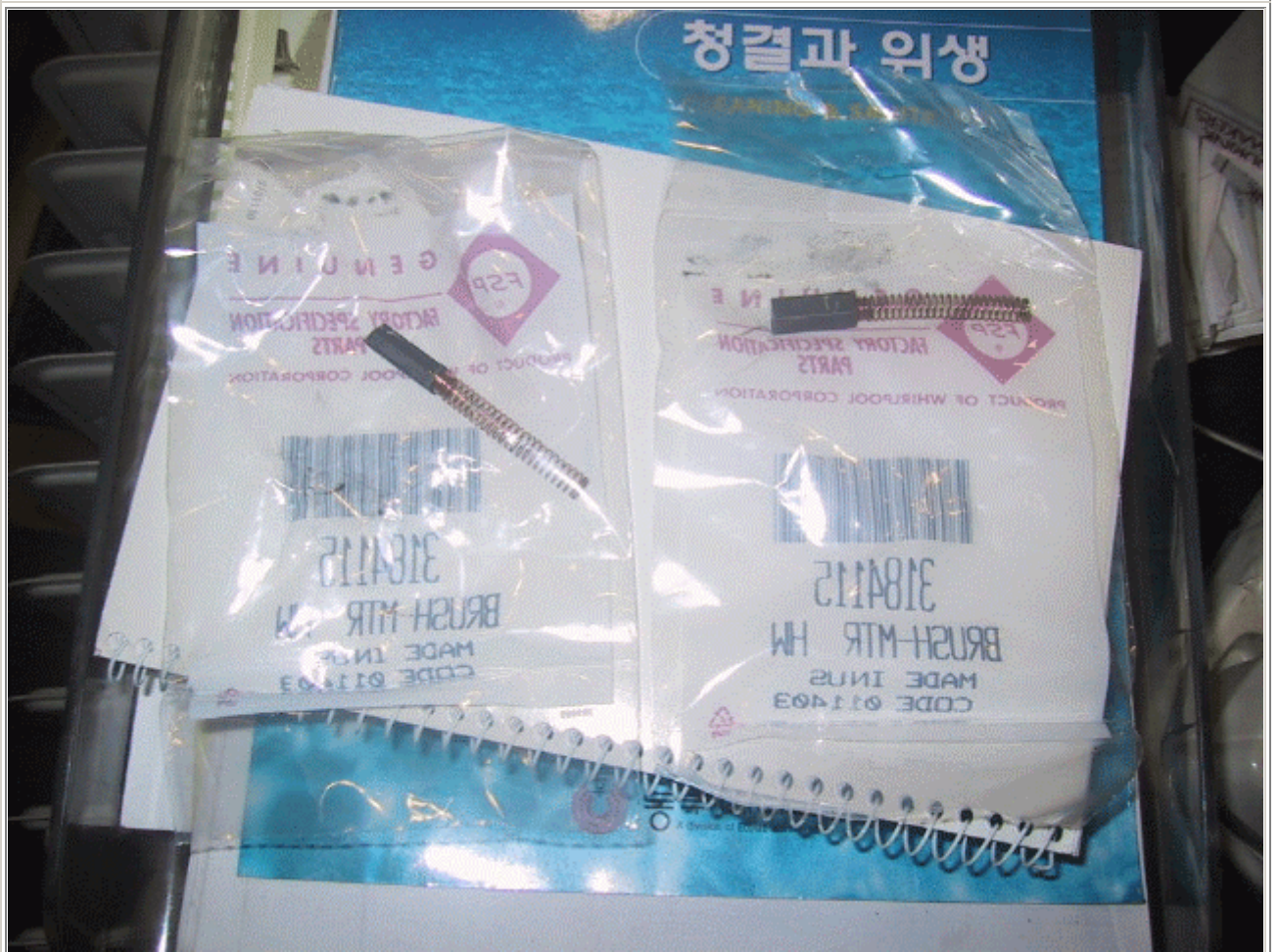
카본의 릉름한 모습