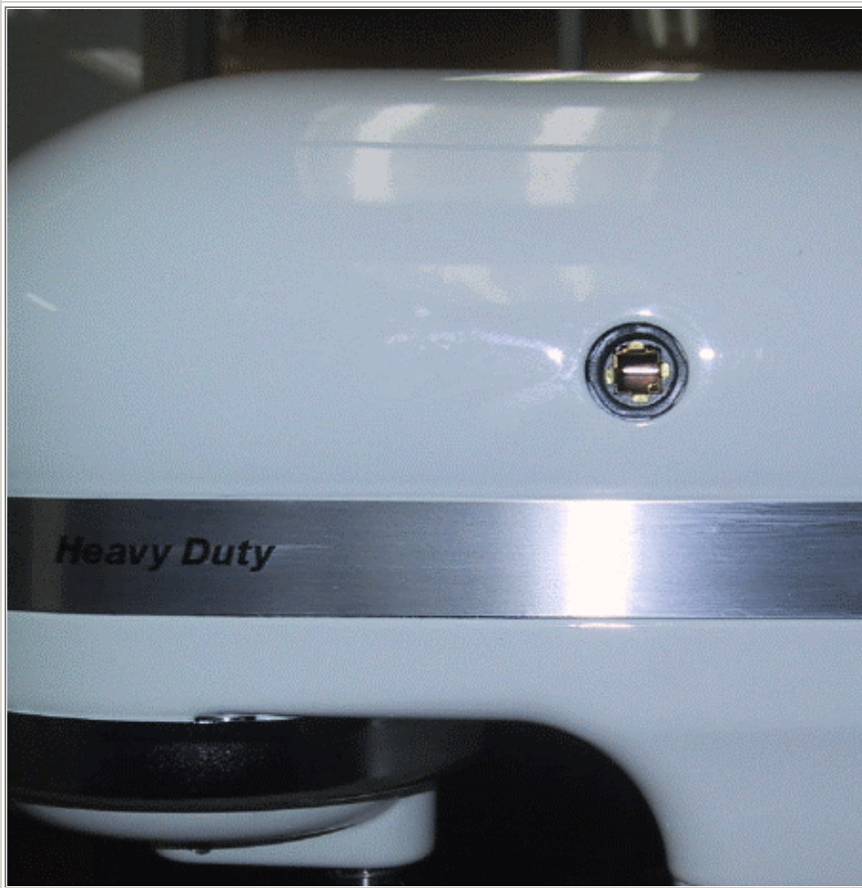
왼쪽의 아름다운 자태